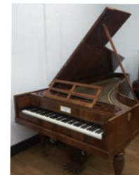
フォルテピアノ (グラフ作ウィーン式アクション)