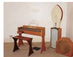
オンド・マルトノ