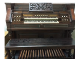
リスト・オルガン (足鍵盤付きリード・オルガン 1897年頃製造)