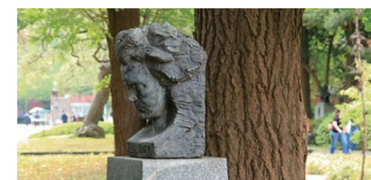
ベートーヴェン像(大学構内)

2020年のベートーヴェン生誕250周年に向けて、「運命」の本邦初演をはじめ、数々の実績を誇る藝大ならではのベートーヴェン！